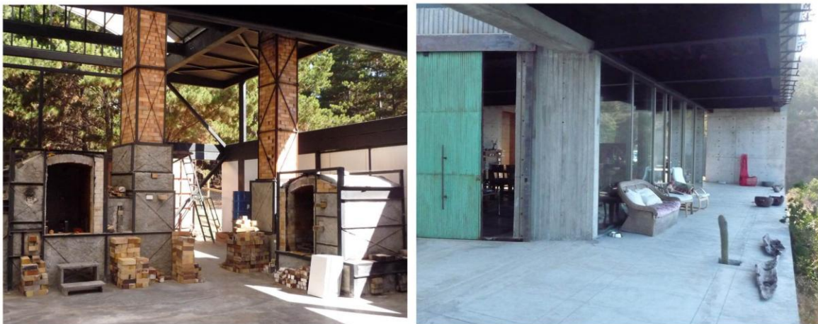
Taller, Hornos y Áreas comunes