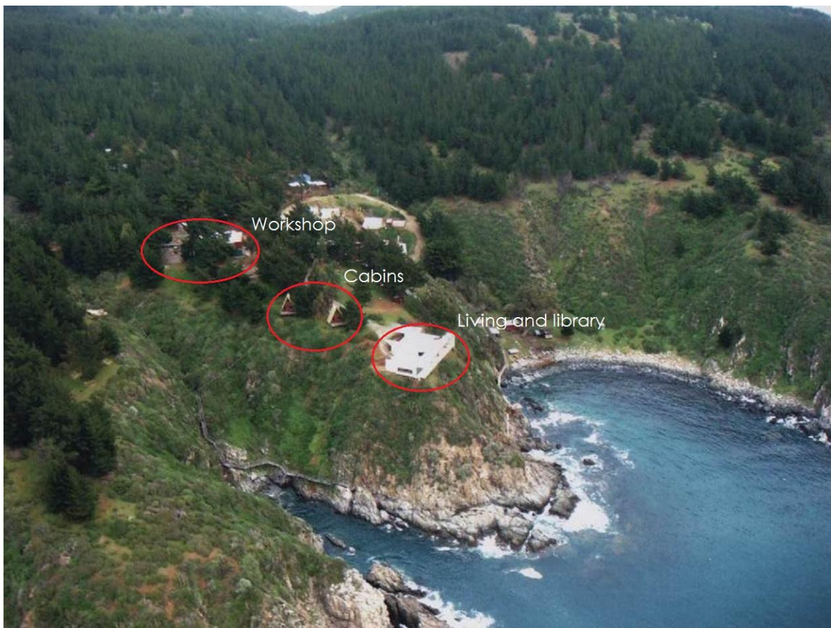
Foto aérea del Centro